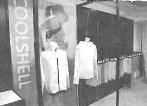
19春夏向けに新世代対応素材を提案した「カフラット」や「デュアルファイ」なども披露した。さらに、同社が新たに開発し、先行開催した大阪展で話題を集めた新感覚。

帝人フロンティアは、4快適アーマを軸にした素材を訴求した。快適機能性とラッシュン性を融合した「新世代スポーツウエア」への要求に対応する。スポーツアパレルは、心と体を快適にするスポート機能とスポーティスタイルを取り込んだ生活のカジュアル化が進んでいることに着目。付加価値の高い商品や幅広い領域のスポートシーンと「プレイオン」プレイオフの両方への対応を指している。